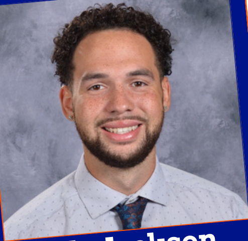
Mr. Jackson Class of 2015

¿Sabía que hay más de 30 miembros del personal de Kelloggsville que son ex alumnos de Kelloggsville?